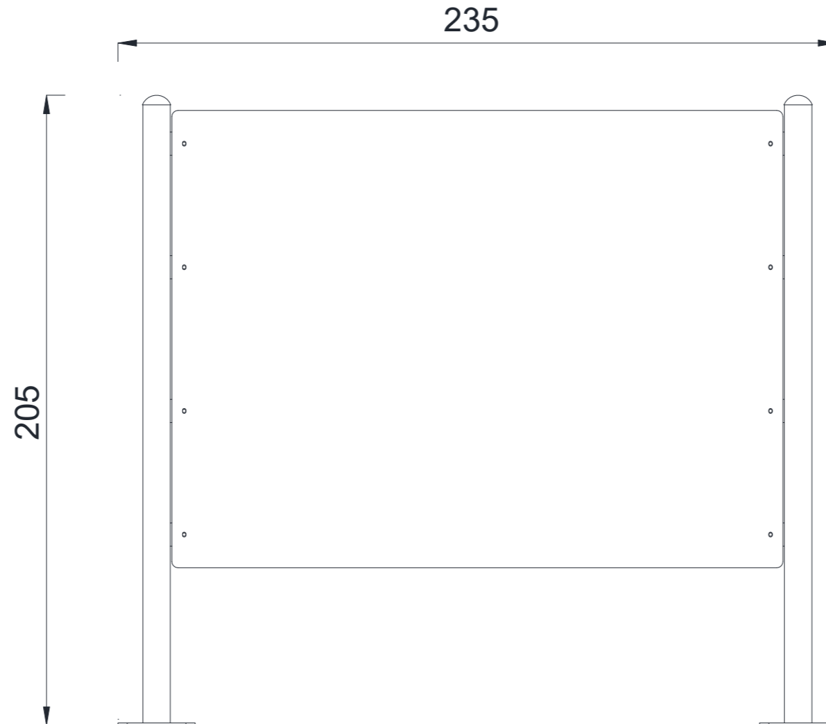
ÖN GÖRÜNÜŞ / FRONT VIEW